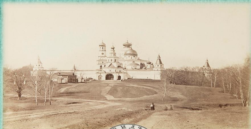
В. М. Д. Д. Воскресенского Новий Иерусалим Мемориал Мозаикари, г. Иерусалим, Израиль

Конечно, посетив действовавший в то время монастырь, он мог думать о нем только грустно, о нем и его обитателях. Для нас, людей светлого настоящего, Воскресенский собор в ансамбле с монастырем – это великая память тем, кто возвел эти изумительные по архитектуре здания, послужившие национальному русскому поэту Михаилу Юрьевичу Лермонтову для создания бессмертных литературных образов.